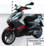
Silberfabel Design (LGM2)